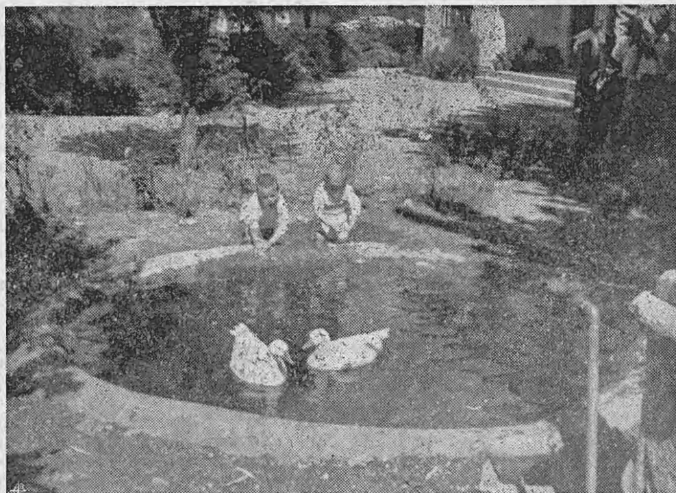
Eis aqui os dois príncipes da Casa de Paço de Sousa. Príncipes porque primeiros. Antes de mais nada, os visitantes vêem os dois. Nem lhes falta o lago, os gansos, os jardins; tudo quanto os torna amáveis. Quem eram? Não se sabe. Todos quantos nós abrigamos, nascem de novo!