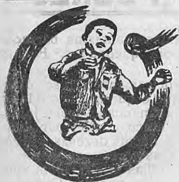
Visado pelo Comissão de Censura