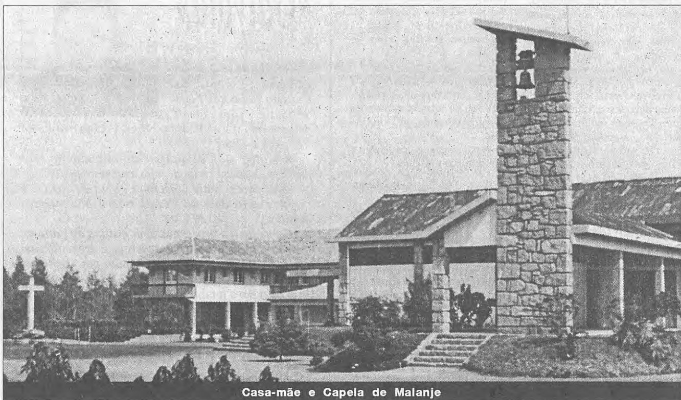
Casa-mãe e Capela de Malanje