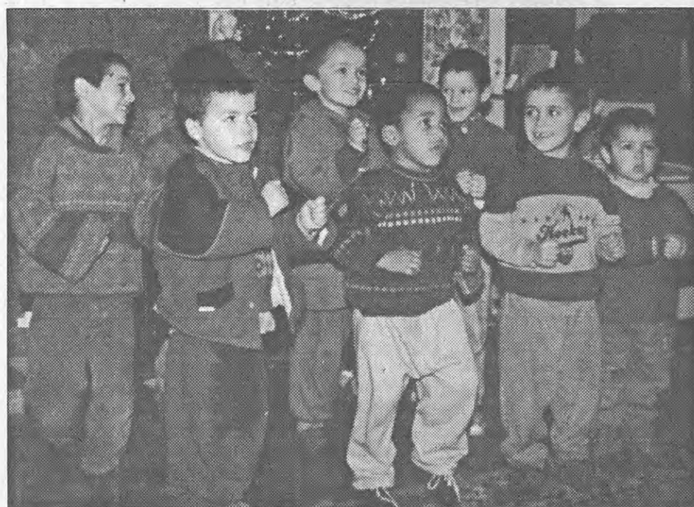
Os «Batatinhas» da Casa do Gaiato de Paço de Sousa