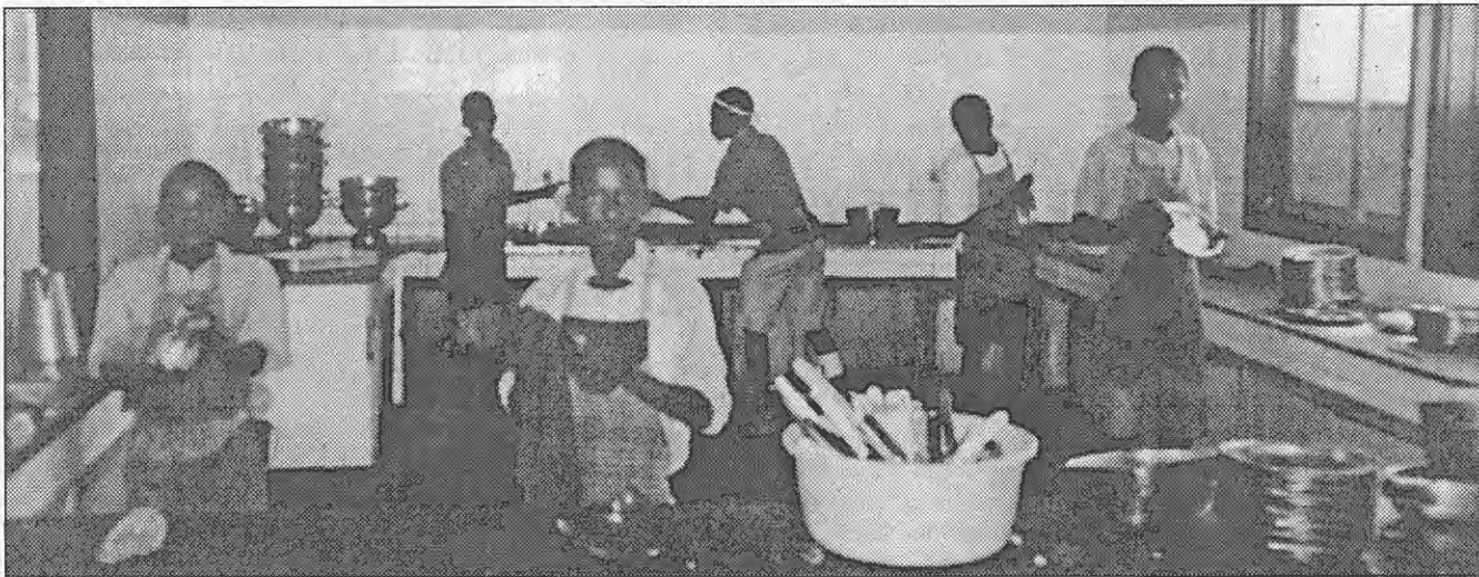
Casa do Gaiato de Benguela — copa da cozinha.