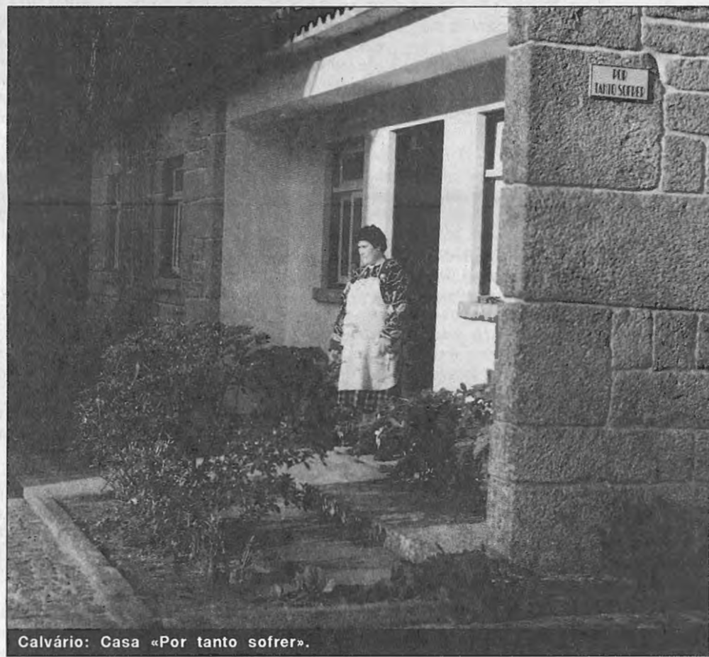
Calvário: Casa «Por tanto sofrer».