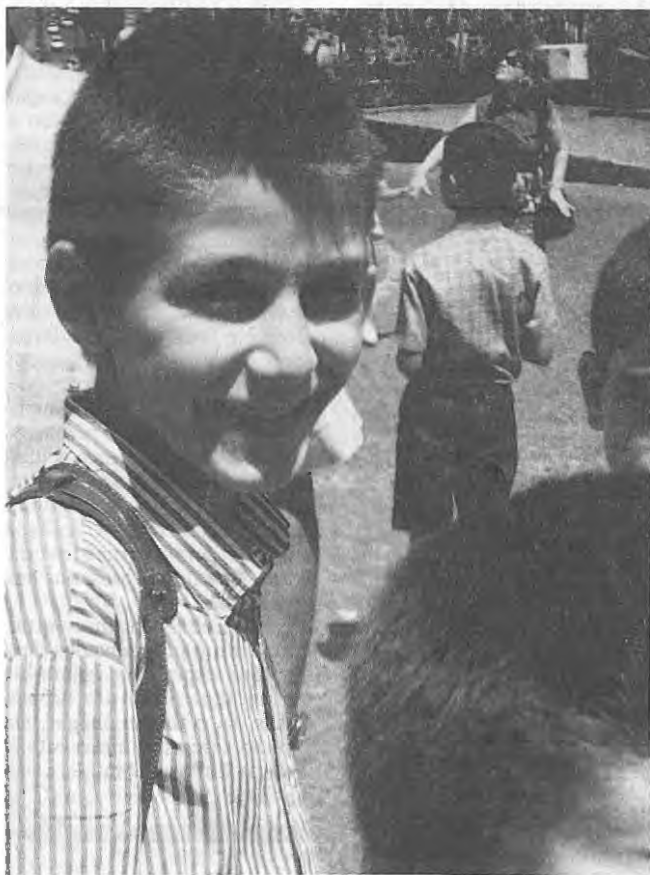
Em cima, um quadro de miséria. Aqui, de sorriso nos lábios, um ressuscitado da Casa do Gaiato de Miranda do Corvo. Quantos Rapazes nossos sofreram no corpo e na alma, as mazelas da barraca!