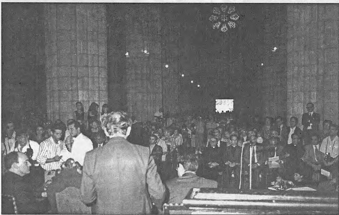
Muita gente na Sé Catedral do Porto