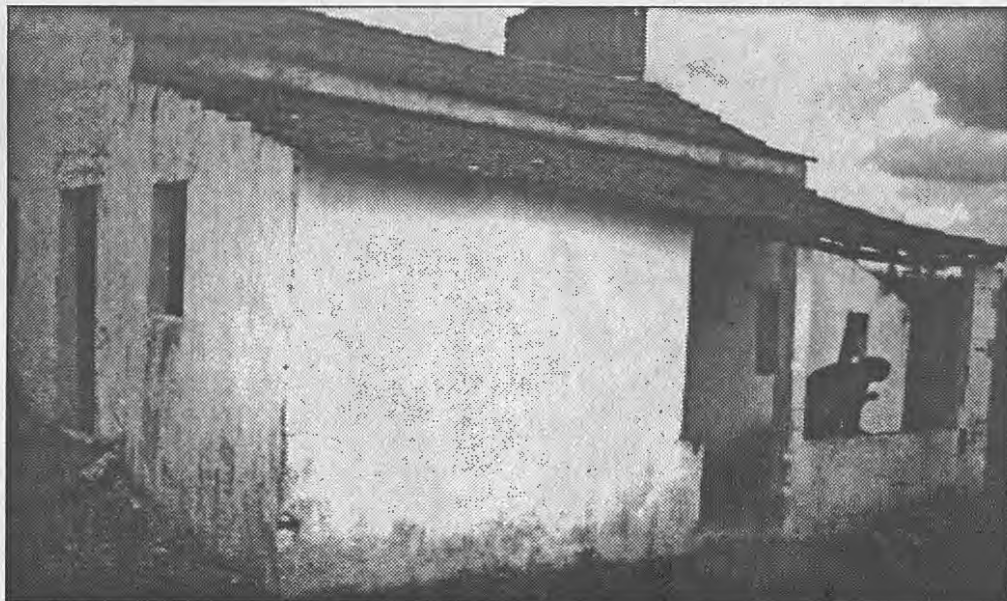
O mau estado do casebre e a situação da família exigem que não haja demoras